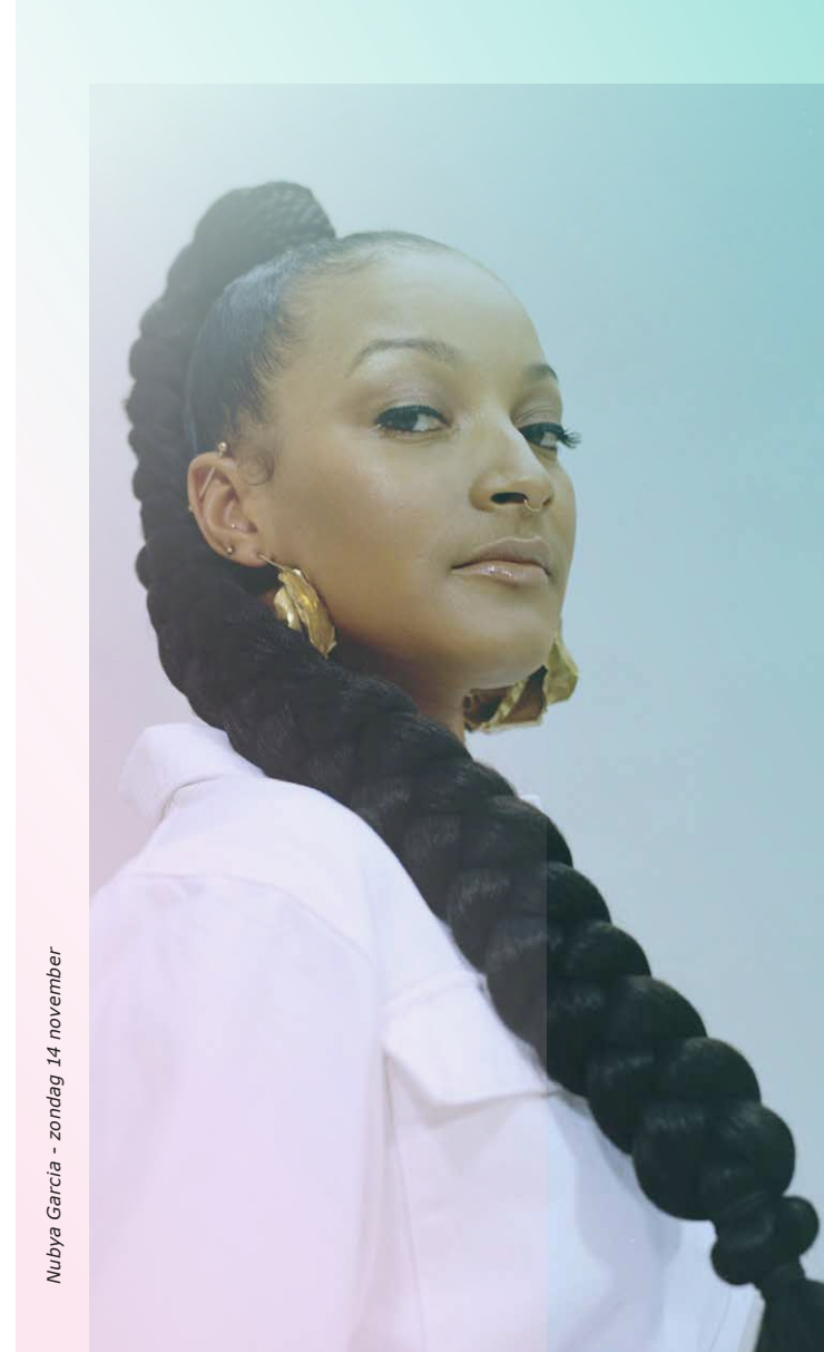
Nubya Garcia - zondag 14 november