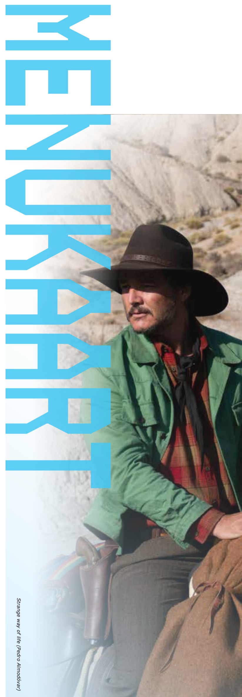
Strange way of life (Pedro Almodóvar)